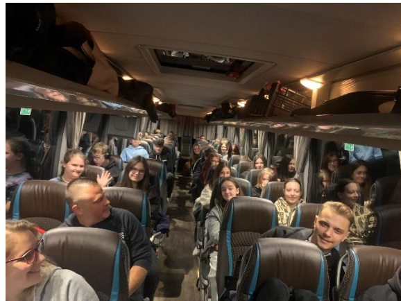
2. Indulás Sopronból a kora hajnali órákban