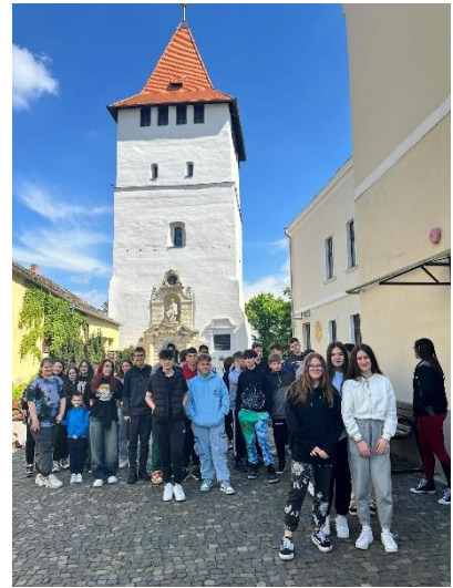
4. Nagyszalonta, Csonka torony