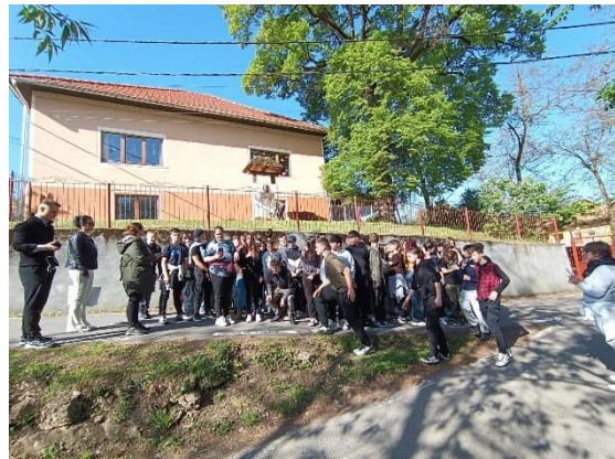
14. Kalotaszentkirály, erődtemplom, Mátyas-harang és Ady emlékhely