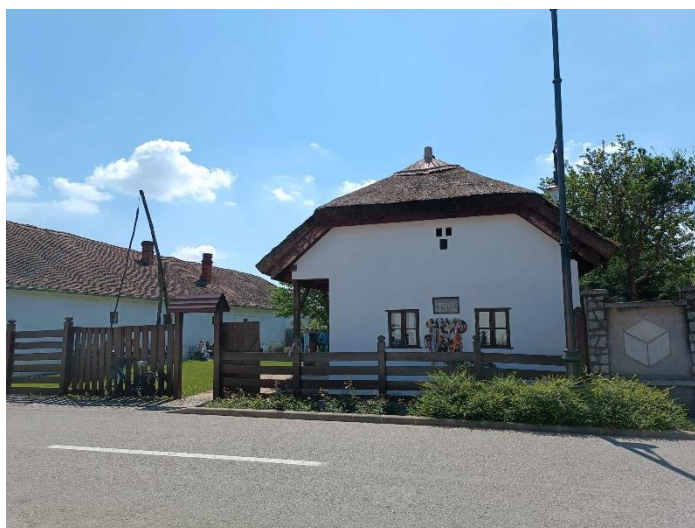
3. Nagyszalonta, Arany János szülőháza