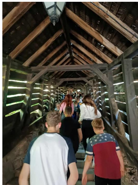
13. Segesvár, Petőfi emlékhely, Diákok Lépcsője

dombról csodálatos kilátás nyílt a városra.