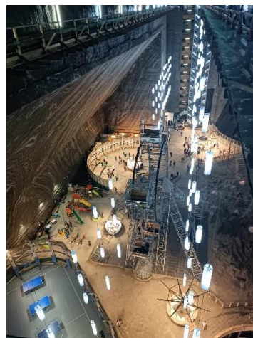
5. Torda, Sóbánya