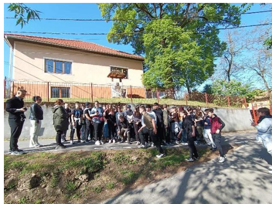
14. Kalotaszentkirály, erődtemplom, Mátyas-harang és Ady emlékhely