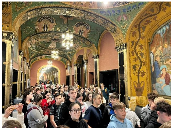
7. Marosvásárhely, Kultúrpalota