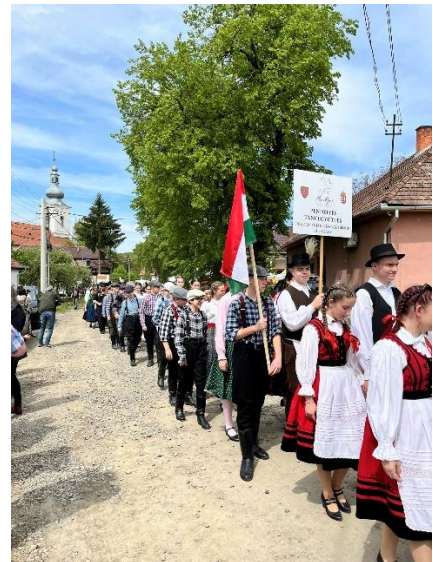
8. Erdőcsinád, Felvonulás