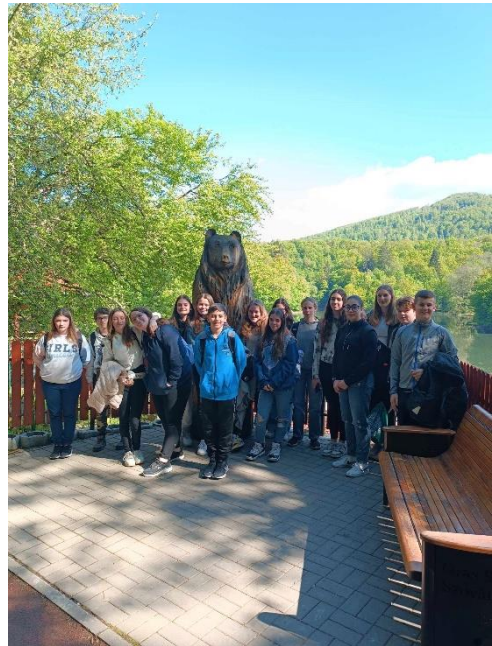
10. Szováta, Petőfi Szobor és a Medve-tó

Szováta után a sóvidék legnevezetesebb településén, Korondon álltunk meg, mely iparművészeti, idegenforgalmi és művészeti központ. Az országút mellett állandó kirakodóvásár van a falu termékeiből. A gyerekek itt kaptak szabadidőt, válogathattak a helyi kerámiákból. Korondon nagyon sok, szép, fából faragott székelykaput is lehet látni.