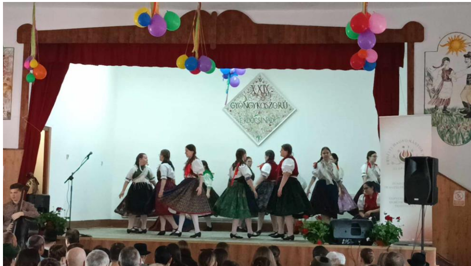
9. Erdőcsinád, XXIX. Gyöngykoszorú fesztivál