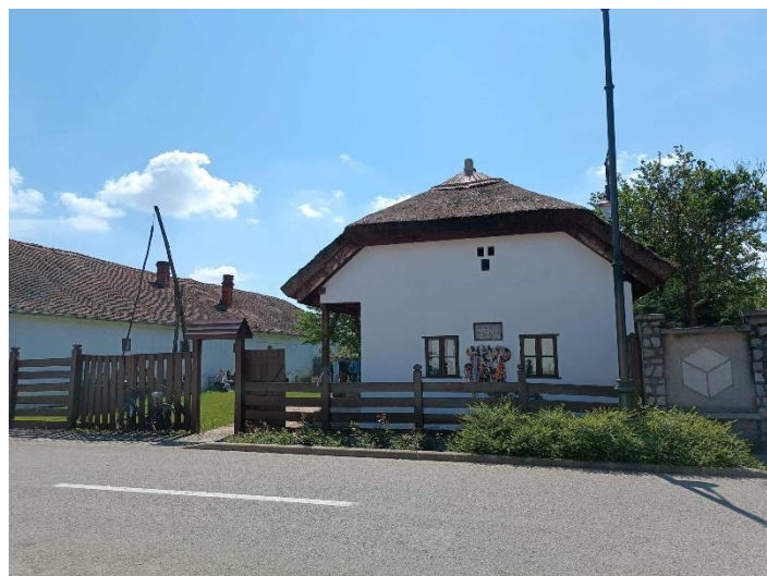
3. Nagyszalonta, Arany János szülőháza