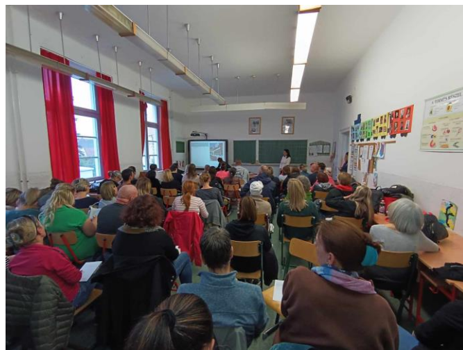
1. Diákok és szülők tájékoztatója