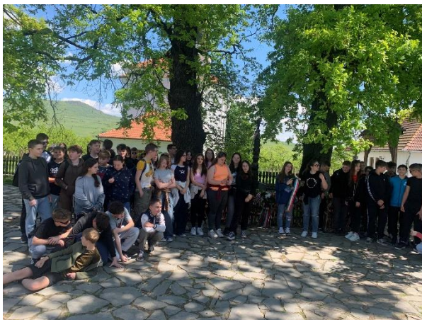
11. Farkaslaka, Tamási Áron sírja, koszorúzás

Ezt követően a Szejkefürdőn lévő Szabadtéri Székelykapu Múzeumot kerestük fel. Ámulatba ejtő látvány volt az egymás után sorakozó kézműves remek sokasága, melyek alatt áthaladva Orbán Balázs 19. századi híres író, néprajzi gyűjtő, fotográfus, országgyűlési képviselő, a Magyar Tudományos Akadémia levelező tagjának síremlékéhez jutottunk. A szabadtéri múzeum mellett elhelyezkedő Mini-Transylvania is felkeltette a gyerekek érdeklődését, így ennek meglátogatását is beiktattuk a programunkba. A Mini Erdély Park Románia egyetlen multikulturális, tematikus makettparkja, melyben Erdély legfontosabb 90 történelmi épületeinek kicsinyített mását tekinthettük meg. Itt is rövid sétát tettünk a gyerekekkel. Lehetőségünk nyílt a kellemes, tavaszi környezetben ebédünk elfogyasztására is.