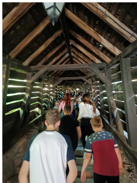
13. Segesvár, Petőfi emlékhely, Diákok Lépcsője

megtekinthettük a német nyelvű középiskola épületét és az evangélikus vártemplomot. A dombról csodálatos kilátás nyílt a városra.