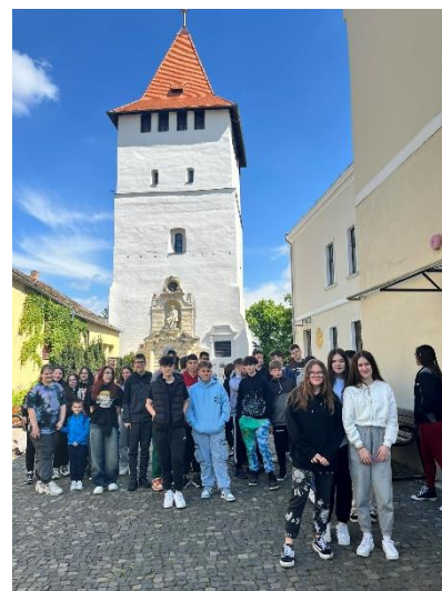
4. Nagyszalonta, Csonka torony