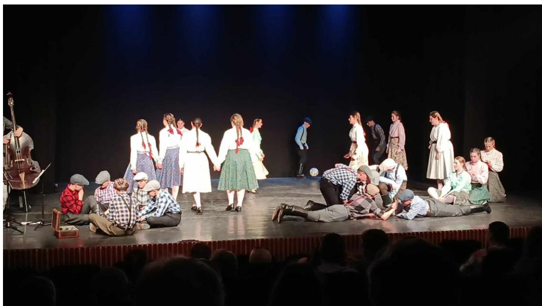
6. Marosvásárhely, Közös fellépés a marosvásárhelyi Napsugár Néptáncgyűttessel

Második éjszakánkat Koronkán töltöttük. Az előadás miatt csak a késői órákban érkeztünk a szállásra. A vacsora elfogyasztása után tértünk nyugovóra.