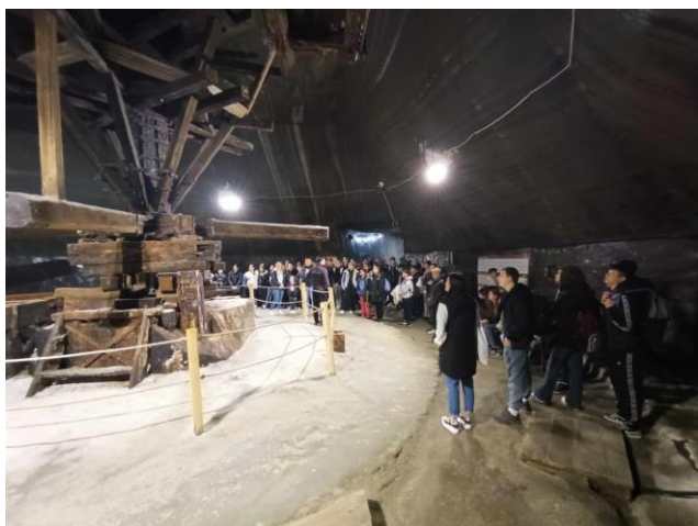
5. Torda, Sóbánya