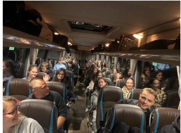
2. Indulás Sopronból a kora hajnali órákban