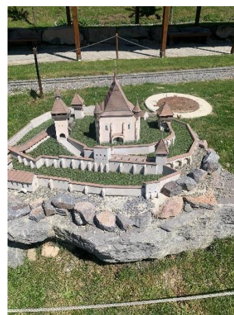
12. Szejkefürdő, Székelykapu múzeum, és Mini Transylvánia