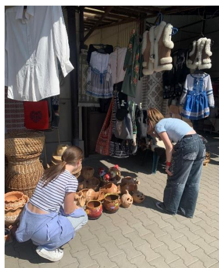
15. Körösfő, kirakodóvásár

Fáradtan, de élményekkel teli szálltunk fel buszunkra. Az út során megcsodálhattuk még egyszer a Királyhágót és Erdély lenyűgöző szépségű tájait. Az esti órákban érkeztünk Sopronba.