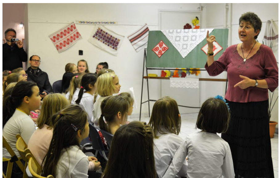
„A versenyen” az 1. osztálytól a 8. osztályig minden évfolyam képviseltette magát. „