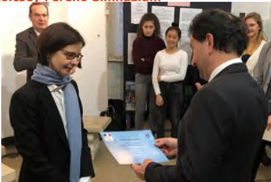
„Az oklevelet Franciaország magyarországi nagykövete, Pascale Andréani asszony adta át az iskolában 2018. december 8-án.”

A Budapest VI. Kerületi Kölcsey Ferenc Gimnázium 2015-ben nyerte