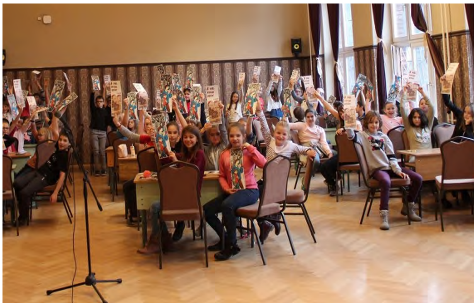
„Idén több mint hatvan kisdíjak vett részt a PUF vetélkedőn.”