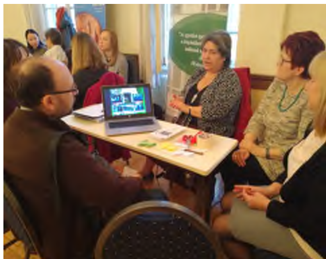
„Az érdeklődők az iskolák standjainál ismerkedtek az intézményi sajátosságokkal.”