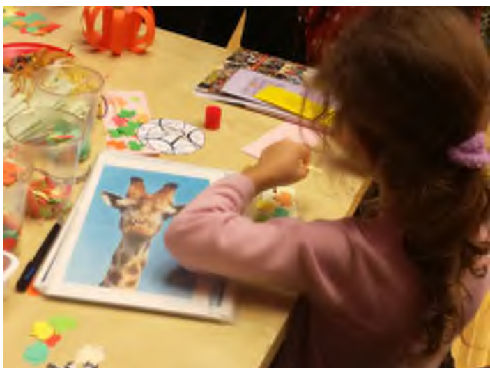
„Az óvodások játékos foglalkozásokon vehettek részt.”