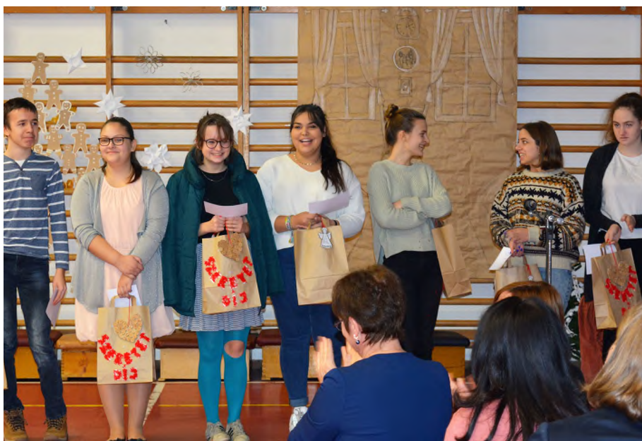
„A Szeretet Díjat idén hét diák vehette át.”