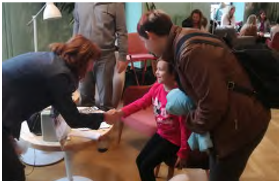
„A kellemes szombat délelőttön a szülők és gyermekek együtt ismerkedhettek az iskolával.”

A hagyományteremtő rendezvény számos érdeklődőt vonzott. A kiállító általános iskolák mellett a kerületi zeneiskolák és a Fővárosi Pedagógiai Szakszolgálat tagintézményeinek szakemberei is fogadták a szülők kérdéseit.