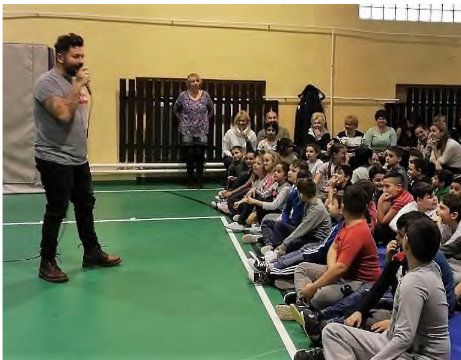
„Mező Misivel énekelünk.”