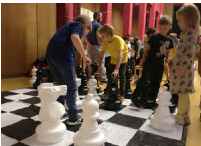
„A Sakkpalota program a Belső-Pesti Tankerületi Központ több intézményében is a mindennapok része.”