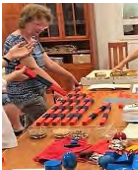
„Bevezető előadást követően az iskola eszközparkjának csoportosításával forgó rendszerű bemutatókra került sor.”

A gyermekek, diákok számára az intézményi szocializációs élettér nem csupán ismeretek szerzésére irányul. Maria Montessori reformpedagógiai irányzatokba illeszkedő szemlélete a Budapesti Bárczi Gusztáv Óvoda, Általános Iskola Készségfejlesztő Iskola tanulói számára optimális lehetőségeket kínál.