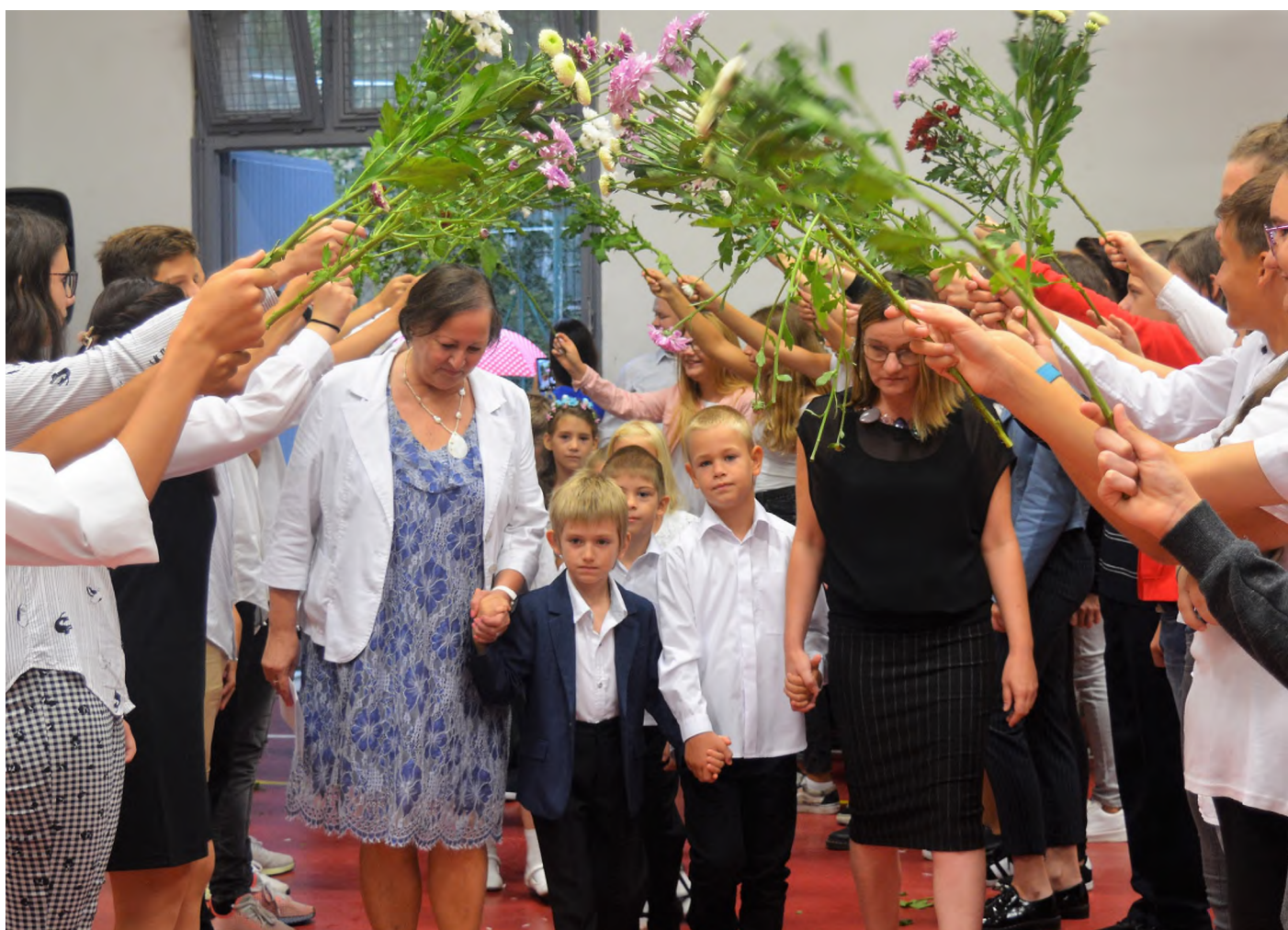
"Virágkapu alatt léptek át az iskolás életbe a legkisebbek."

Szeptember 3-án országszerte hivatalosan is kezdetét vette a 2018/19-es tanév. A Belső- Pesti Tankerületi Központ Derkovits Gyula Általános Iskolájában az első osztályosok köszöntésével kezdődött a tanévnyitó.