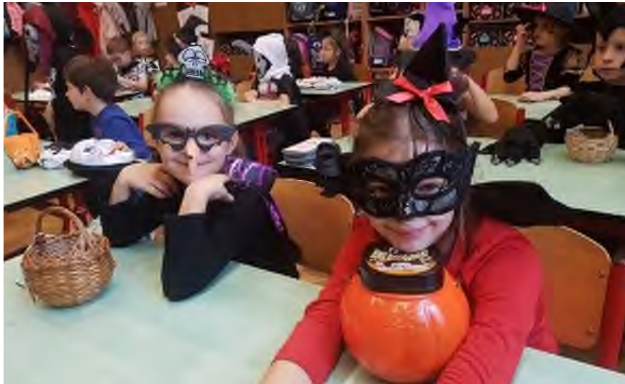
„A gyerekek a haloweeni tradíciókkal ismerkedtek.”