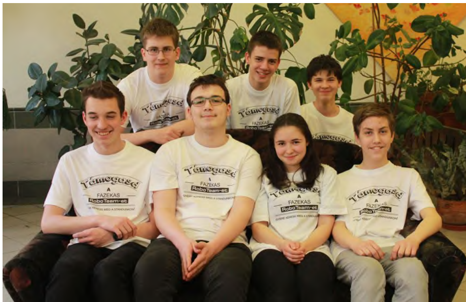
„A Fazekas csapata”