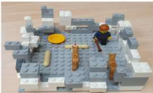
Az enniváló nem a tied!