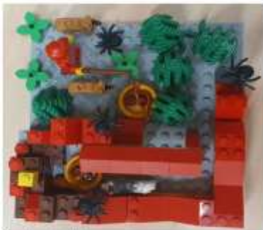
Jönnék a vadászok!